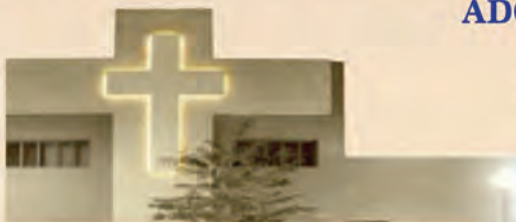
Jezuicki Ośrodek Milenijny

Spowiedź w 1. piątek miesiąca - 7:30-8:30; 17:30-19:30